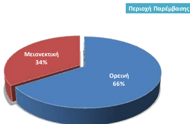
Διάγραμμα 1-1: Κατανομή των ορεινών – μειονεκτικών στην περιοχή παρέμβασης

Από το σύνολο του Δήμου Τρίπολης στην περιοχή παρέμβασης εντάσσονται οκτώ Δημοτικές Ενότητες και 78 Τοπικές Κοινότητες, εκ των οποίων 44 χαρακτηρίζονται ως ορεινές και 34 ως μειονεκτικές περιοχές: